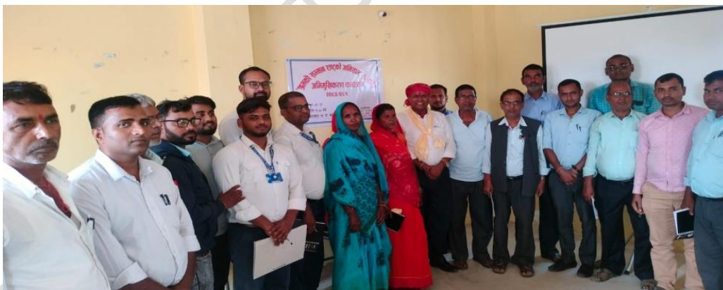
श्रमको सम्मान राष्ट्रको अभियान सम्बन्धी अभिमुखिकरण कार्यक्रम